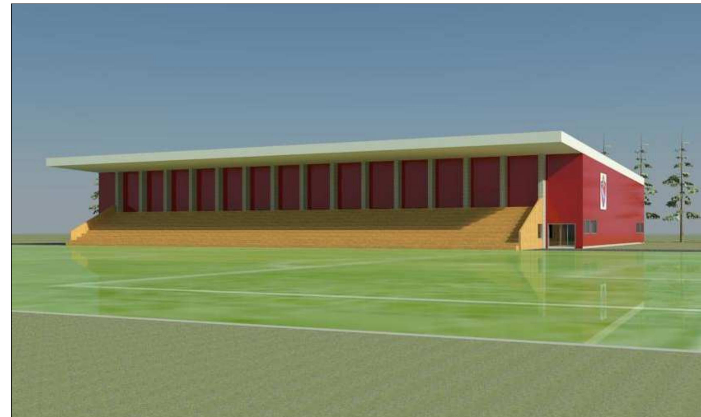
4. SJÓNARHORN FRÁ NÚVERANDI ÍPRÓTTAMÍÐSTÖÐ. ÁSÝND AÐ KNATTHÚSI SAMBYGGT STÚKU.