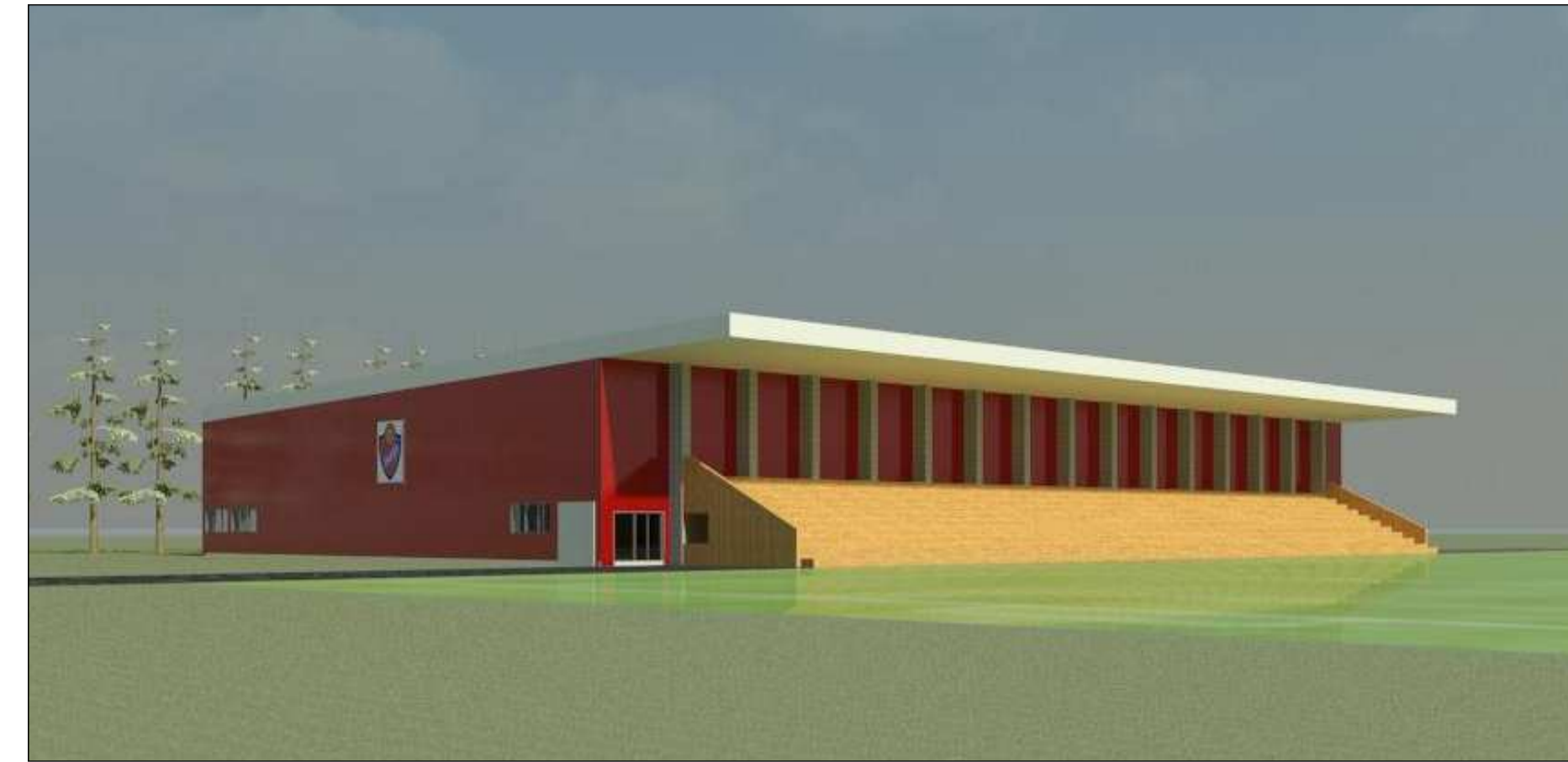
2. SÉÐ FRÁ NORÐRI ÁSÝND AÐ KNATTHÚSI SAMBYGGT STÚKU.