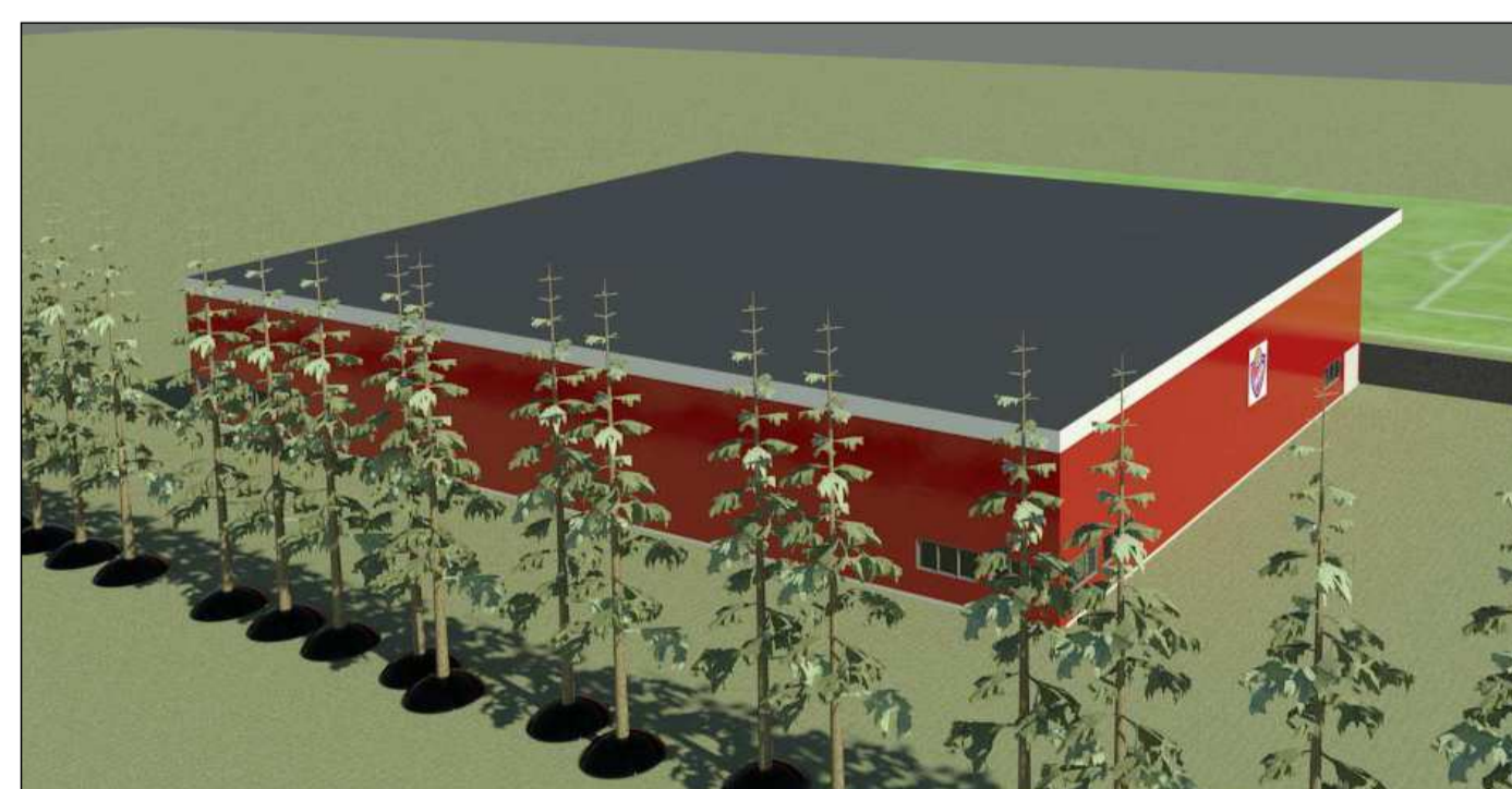
5. SJÓNARHORN FRÁ SUÐRÍ (SUÐAUSTRI)

ÞESSAR ÁSÝNDARMYNDIR ERU SKÝRINGARMYNDIR ÞAR SEM Í MEGINATRÍÐUM KEMUR FRAM UMFANG OG ÁSÝND Á KNATTHÚS ÁSAMT YFIRBYGGÐRI STÚKU. HÖNNUN MANNVIRKIS LIGGUR EKKI FYRIR EN ÁSÝNDARMYNDIR GEFA HUGMYND AÐ ÞVÍ HVERNIG ÞETTA GÆTI LITIÐ ÚT.