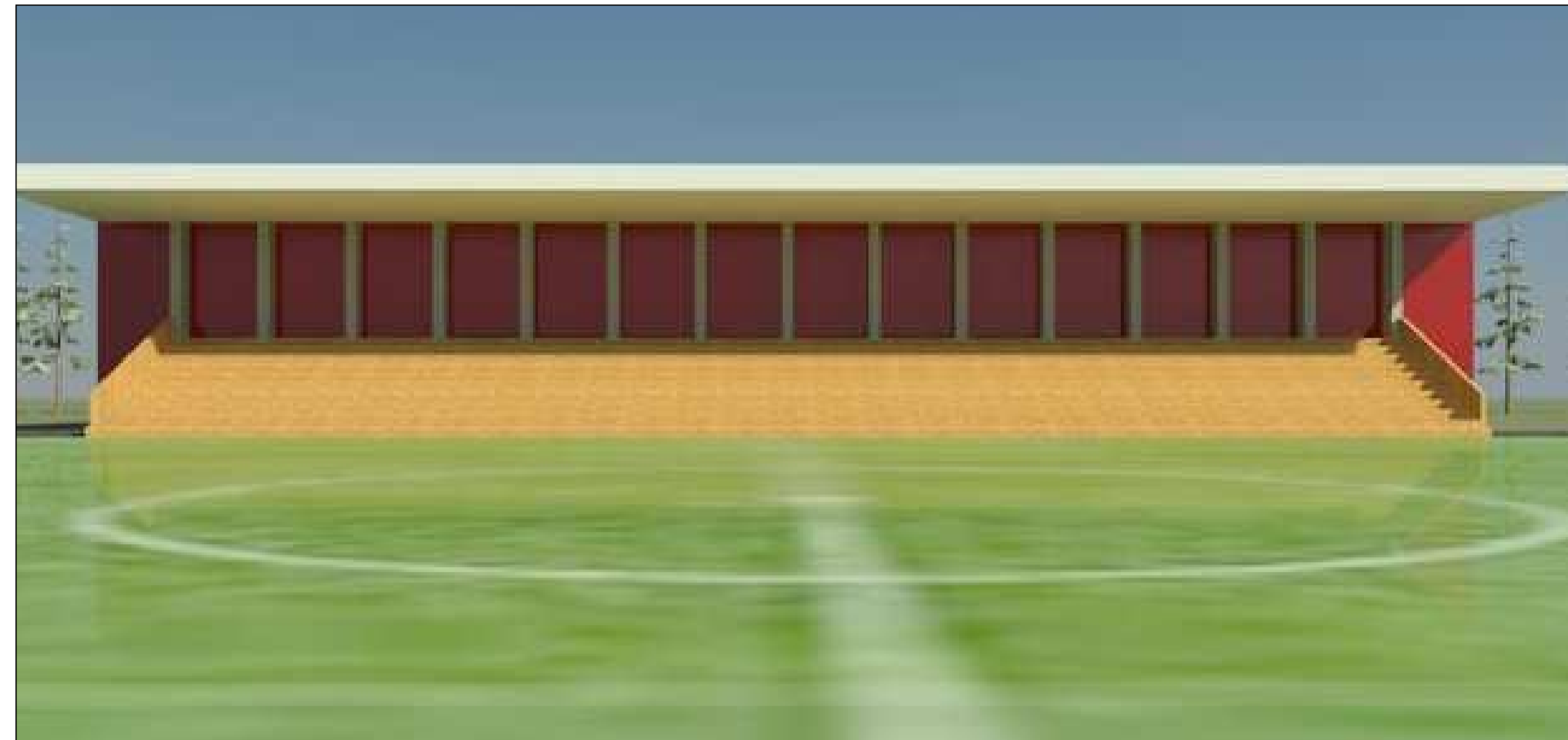
1.SÉÐ YFIR NÚVERANDI GERVIGRASVÖLL( FRÁ VESTRI) AÐ STÚKUBYGGINGU, KNATTHÚS SAMBYGGÐ AFTAN VIÐ STÚKU.