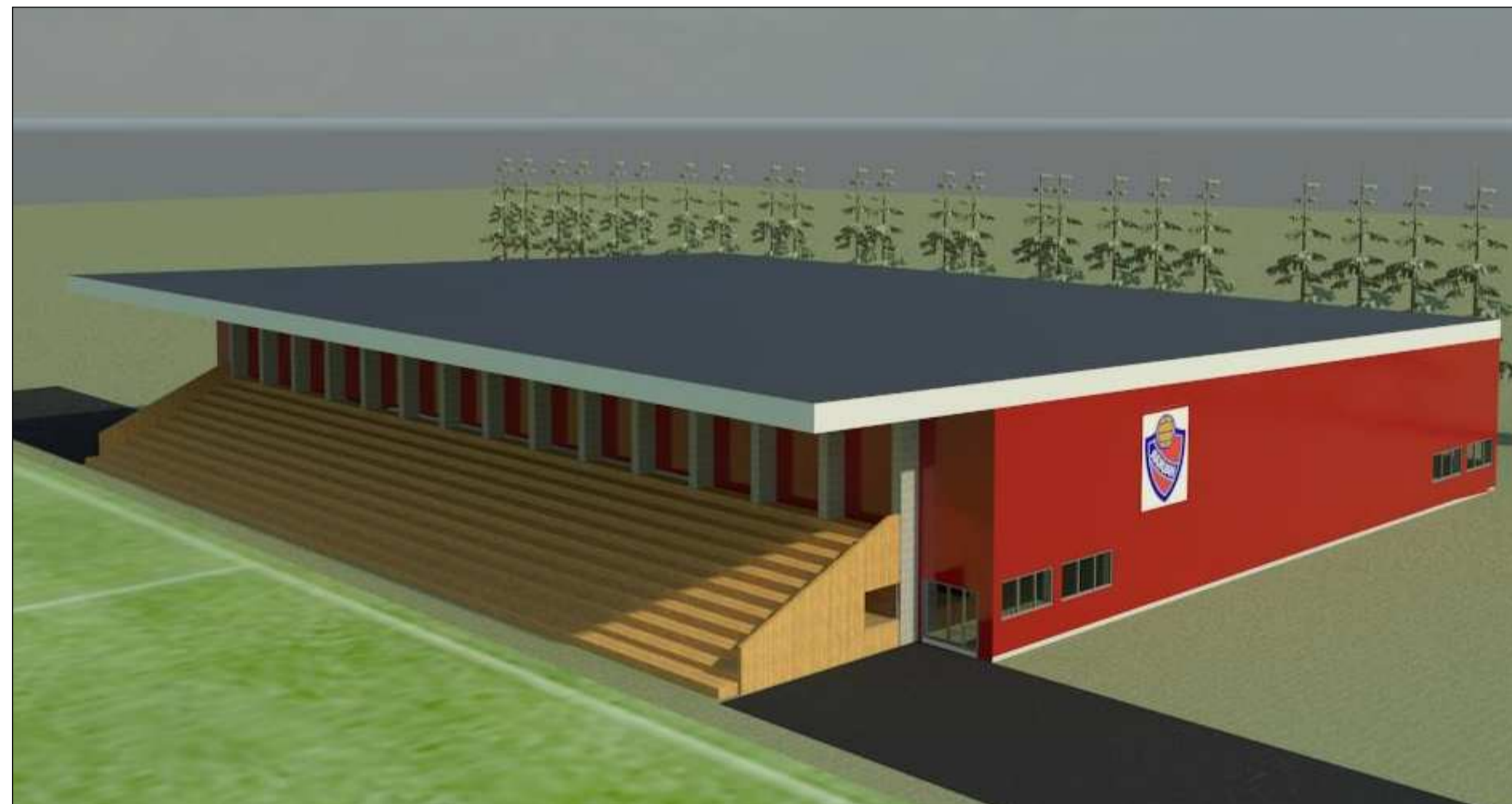
3. ÁSÝND FRÁ NORÐVESTRI.